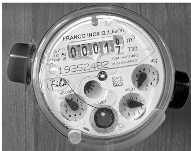
Przykład dla licznika ze wskazaniem 16,6209 m 3 .